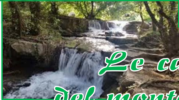
Le cascate del monte Gelato